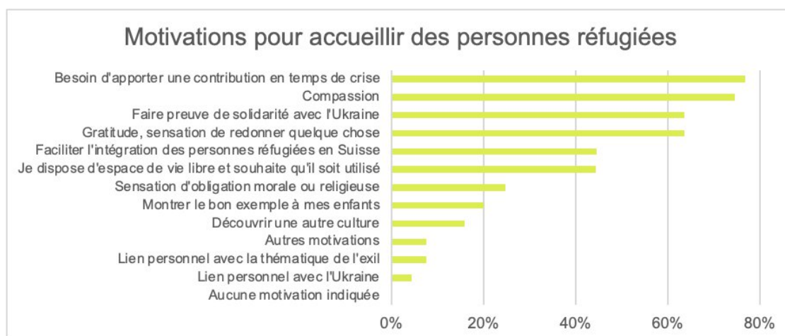
Illustration 1 : Strauss et al. 2023, p. 6.

Le graphique ci-dessous, tiré du rapport sommaire (Strauss et al. 2023, p. 6), montre les motivations qui poussent à accueillir des personnes réfugiées.